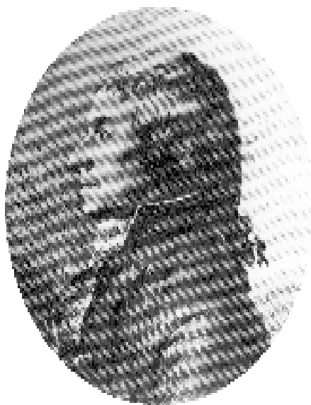
Joseph Louis Proust, químico y farmacéutico francés (1754-1826)

Este Colegio se convirtió, pues, en una institución prestigiosa, apoyada y bien dotada, como “proyecto ilustrado” de la Corona que era, y que con todo merecimiento pudo ostentar con orgullo, durante los noventa y ocho años (de 1764 a 1862) que permaneció en este Alcázar segoviano, el lema: “ La Ciencia vence ”.