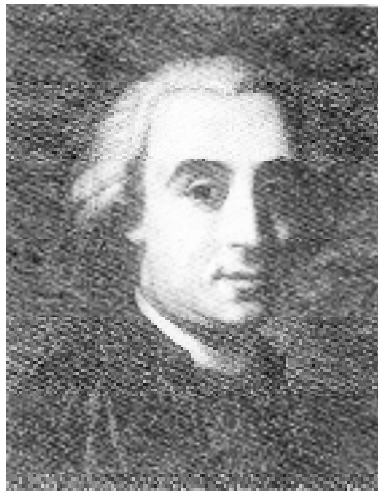
Padre Antonio Eximeno S. J. Profesor Primario del Colegio de Artillería (1729-1808)

Los artilleros siempre hemos venerado y ejercitado unos valores éticos que han definido un especial “estilo”. Unos valores que, unidos a los comunes del resto de las Fuerzas Armadas (valor, entrega, patriotismo, etc....) han distinguido siempre al artillero, como son: “el compañerismo”, “el respeto a la tradición” y “el espíritu de equipo”.