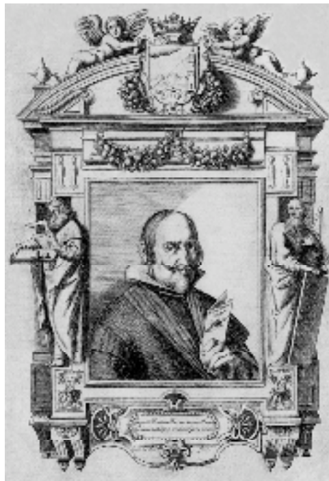
Julio César Firrufino (¿-1651), en El perfecto artillero .

En el siglo XVIII, con la llegada de los Borbones, se inicia “el Despotismo Ilustrado”, como consecuencia de una filosofía y un fenómeno cultural de enorme trascendencia: “La Ilustración”, que coincide con la culminación en Europa de un proceso intelectual que, basado en la confianza depositada en el saber científico, busca el progreso de la humanidad, el conocimiento de la naturaleza y sus leyes y la aplicación de las técnicas desarrolladas y de los descubrimientos realizados, para la mejora del bienestar individual y social y el logro de la felicidad de los pueblos.