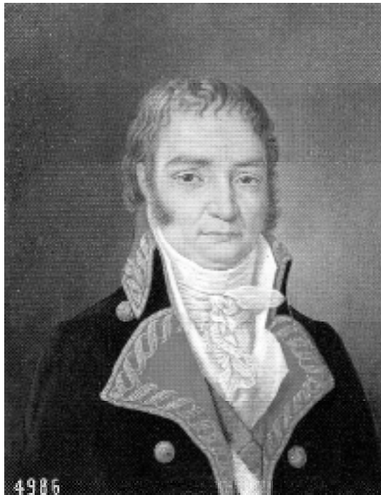
Tomás de Morla y Pacheco, Director General de Artillería, Teniente General del Ejército (1747-1811). Academia de Artillería

Tomás de Morla y Pacheco, militar ejemplar, político y claro ejemplo de artillero ilustrado, autor de obras básicas para la Artillería: Tratado de Artillería para uso de la Academia y El arte de fabricar la pólvora .