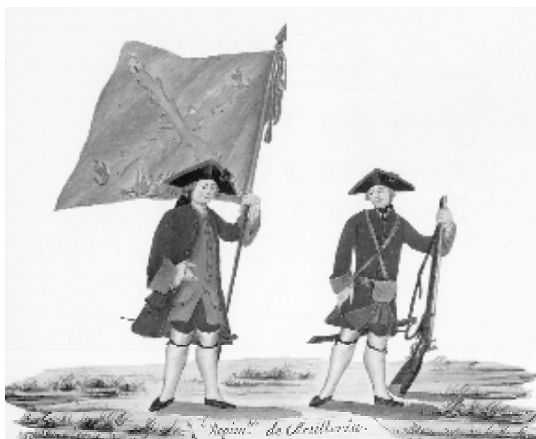
Regimiento Real de Artillería de España (1710).

Ya el 2 de mayo de 1710 Felipe V crea el Regimiento de Real Artillería de España y con la Ordenanza de 15 de julio de 1718 , se unifican y racionalizan las fundiciones y los calibres de la artillería que, desde entonces, se denominará Artillería de Ordenanza .