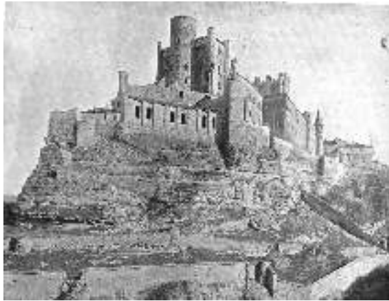
El Alcázar de Segovia, tras el incendio de 1862

Y para ello me gustaría imaginarme que, delante de mí, están sentados los alumnos de la Academia de Artillería, de este prestigioso y glorioso Colegio que dentro de dos años, en el 2014, cumplirá 250 años de su fundación, un 16 de mayo de 1764, en este mismo lugar dónde ahora nos encontramos.